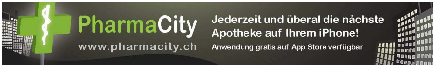
Bild4: Das Iphone-App PharmaCity weist den Weg zur nächsten geöffneten Apotheke.

Bild3: Teil des kantonalen Notfallnetzes und 365 Tage im Jahr geöffnet sind auch die drei Landapotheken Amavita Flughafen Kloten, Apotheke im Bahnhof Uster und die Central-Apotheke Thalwil.